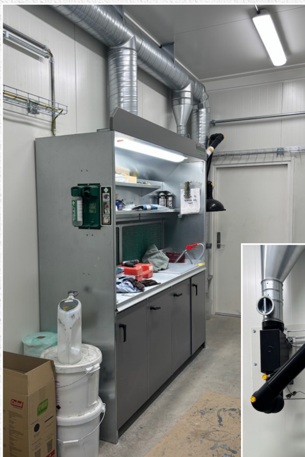
Dragskåp med tvättho. Standard i alla färgblandningsrum.

Vi är nöjda med vår nya lackeringsanläggning, som innebär att vi nu kan producera en bättre produkt och det med kortare ledtider”