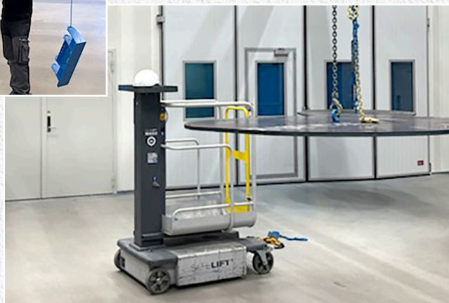
Upphängt gods innan lackering. EX-klassad lyft för användning i lackbox.