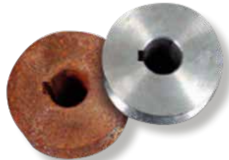
Resultatet, före och efter blästring med HOLD*BLAST.