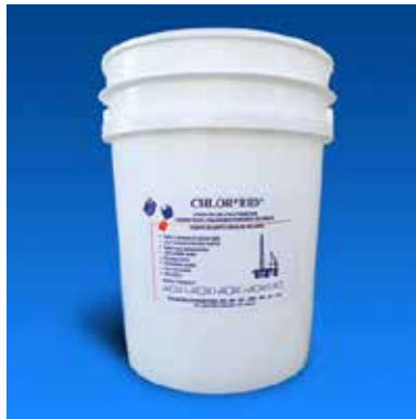
CHLOR*RID är en tillsats som får bort salt från stålet.