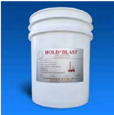
HOLD*BLAST är en tillsats för att fördröja återrostning vid blästring av stål.

– CHLOR*RID är en tillsats som används om det som ska blästras finns i en salt miljö, som t.ex. hamnar, fartyg etc. Med traditionella metoder som högtryckstvättning och blästring är det stor risk att vattenkristaller finns kvar i stålets porer. Med våtblästring och tillsats av CHLOR*RID så får man garanterat bort all salt i ett moment. Vi har distributionsavtal på bägge produkterna för Skandinavien och intresset från marknaden här är mycket stor, säger Björn Stam.