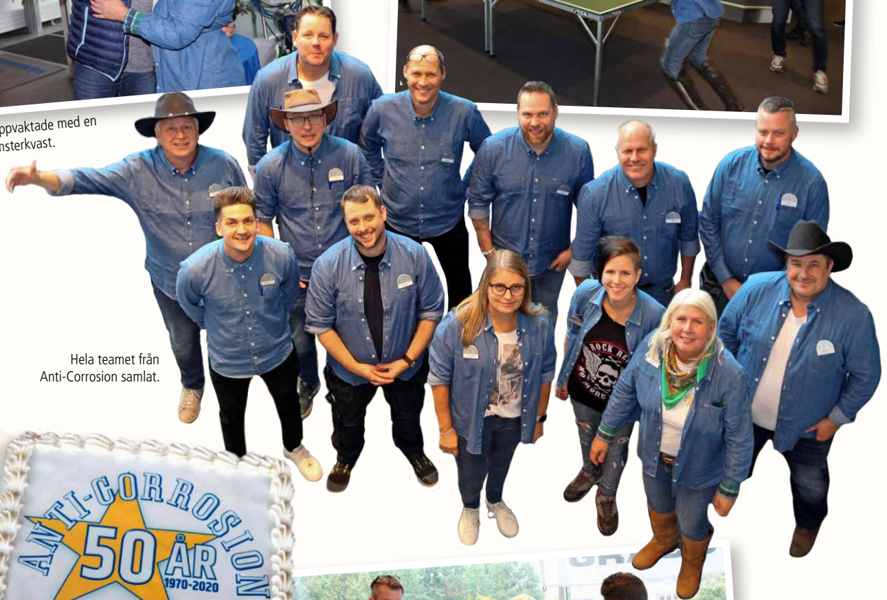
Hela teamet från Anti-Corrosion samlat.