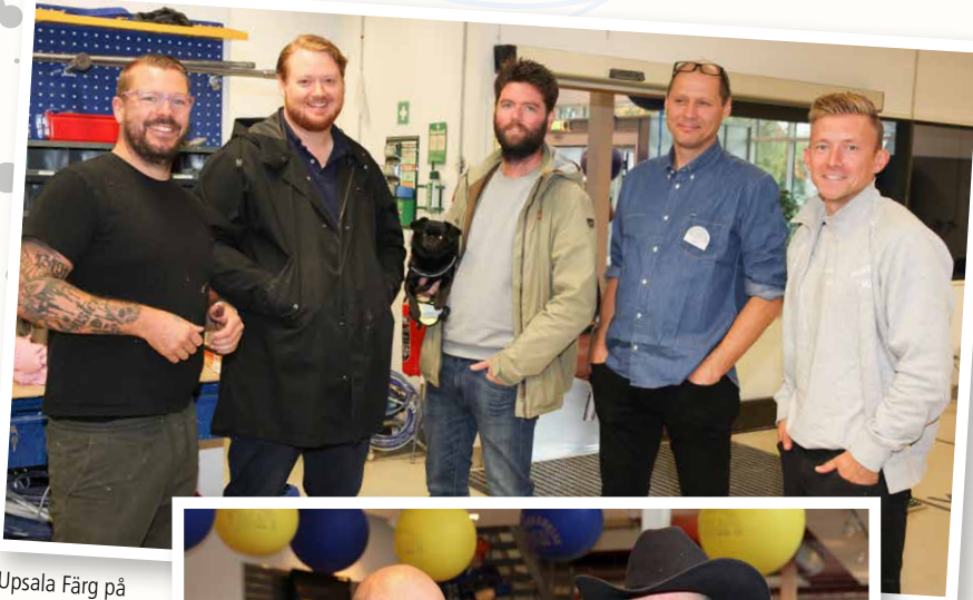
Upsala Färg på besök.