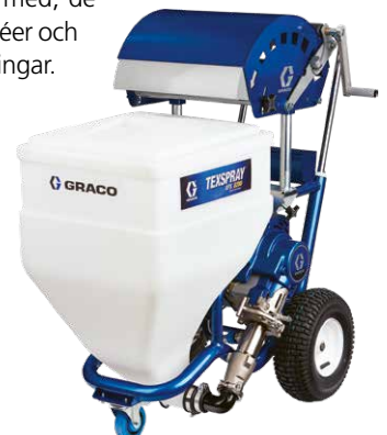
Graco APX 8200.

– Vi har höga krav på våra leverantörer och samarbetar sedan länge med Anti-Corrosion. Här köper vi ny maskinutrustning när det behövs och de utför också löpande service på våra maskiner. Sist men inte minst är de bra att ha att göra med, de kommer med idéer och hittar alltid lösningar.