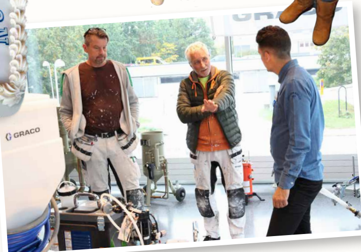
Det var stort intresse för produkterna som visades i utställningen.