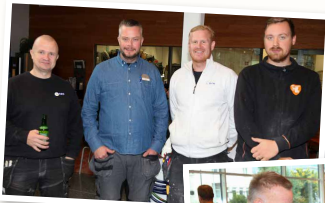
Grabbarna på Täby Brandskyddsteknik tittade förbi.