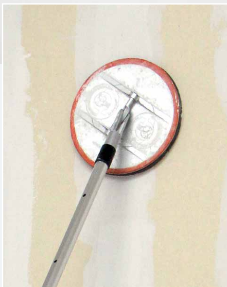
Slipning av gipsskarv.

Text: Fredrik Brokmark, Saint-Gobain och Anders von Kraemer, Anti-Corrosion.