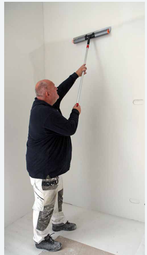
Slätning av bredspacklad gipsvägg.

För helspacklade gipsytor finns det bara en optimal lösning – att nyttja en sprutspackelmaskin”