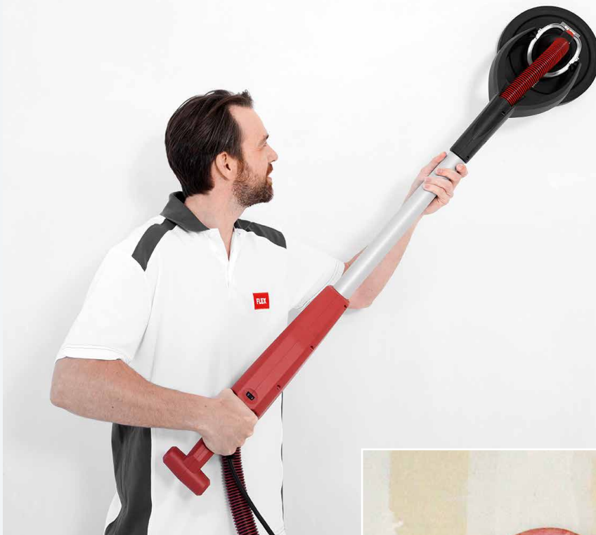
Maskinslipning av bredspacklad yta.