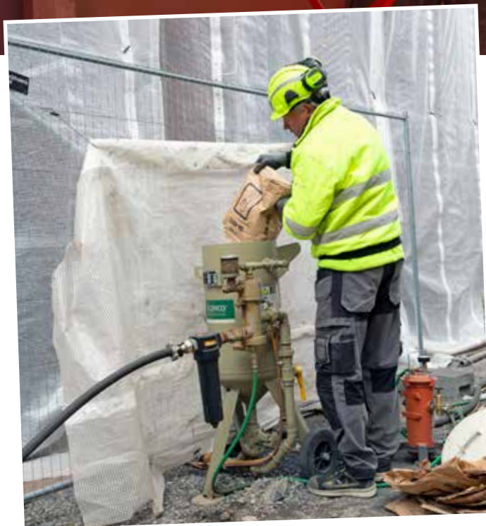
Blästerklockan går för högtryck.