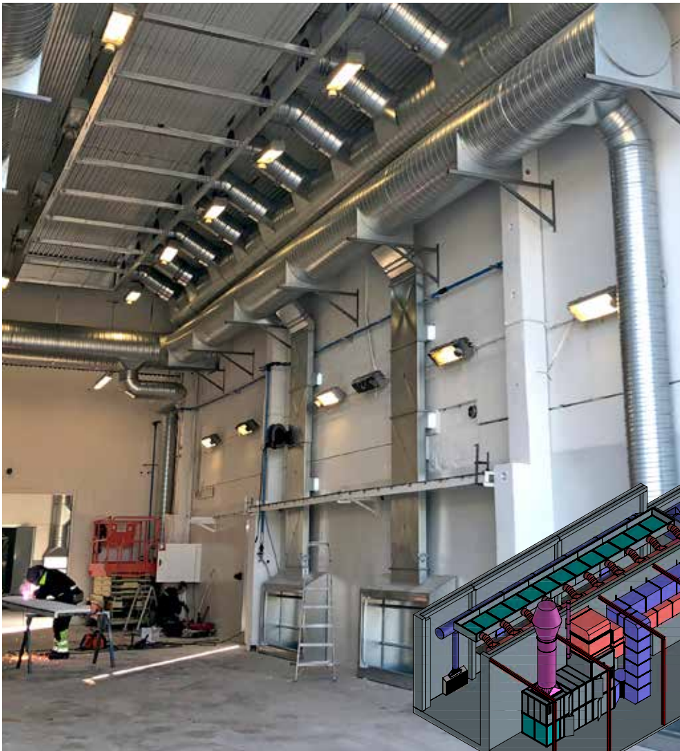
En av de två lackboxarna, komplett med ventilation och värme.

på båten som målas. Sedan många år tillbaka köper vi det mesta av målnings- och blästringsutrustning från Anti-Corrosion. Därför var det naturligt att vi kontaktade dem när vi nu behövde investera i en ny lackbox, då vår gamla anläggning hade blivit omodern.