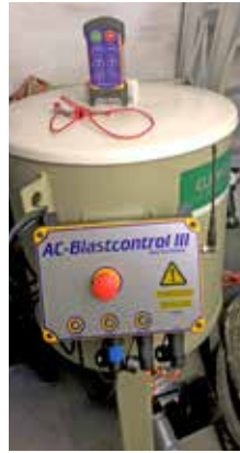
AC-Blastcontrol III är ett trådlöst radiosändarsystem för styrning av blästerutrustning.

– Tack vare möjligheten att kunna smygköra blästerklockan med lägre tryck och minskad mängd sand klarade vi uppdraget och kunden är mycket nöjd med resultatet. Det här har gjort att jag fått lite "blodad tand" och vill gärna göra fler ömtåliga objekt där det gäller att kunna köra så här fint, till exempel kyrkor, skolor m.m. Jag uppskattar den goda supporten från Anti-Corrosion och att de snabbt kunde bygga om blästerklockan för det här uppdraget. Sen vill jag även passa på att tacka Arcona, SISAB och Riksantikvarieämbetet för ett bra samarbete. ■