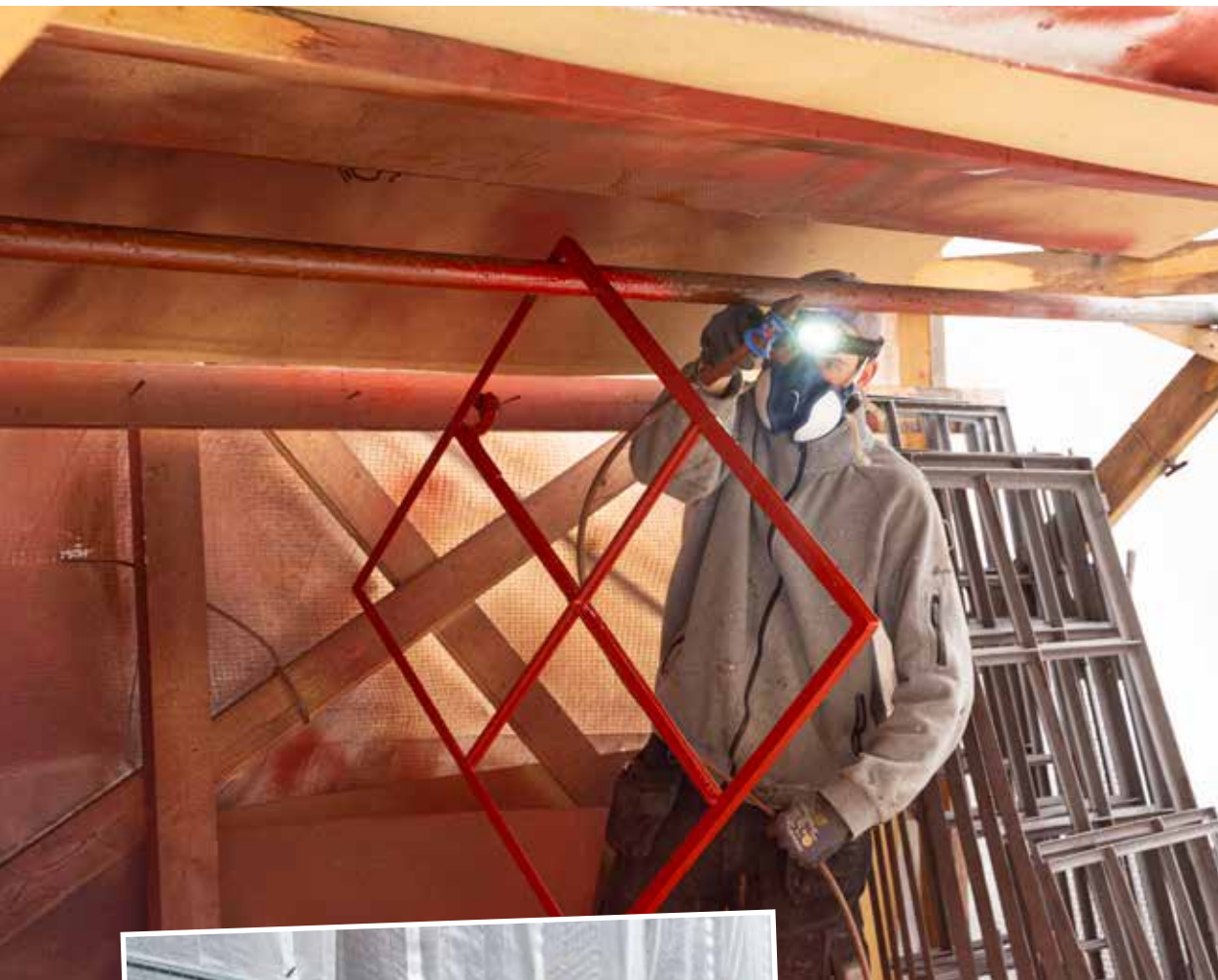
Målningen utförs snabbt och smidigt med färgsprutan Graco GX FF.