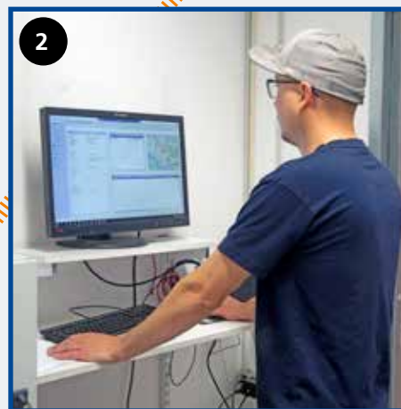
Service och serienummer registreras i Anti-Corrosions system. Inlämningskvitto lämnas över till kund.