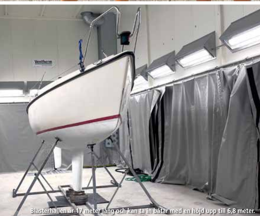
Blästerhallen är 17 meter lång och kan ta in båtar med en höjd upp till 6,8 meter.

För att få bort gammal bottenfärg finns det två lösningar, antingen skrapar man botten , ett stort jobb som tar cirka 14 dagar, eller så blästrar man ”