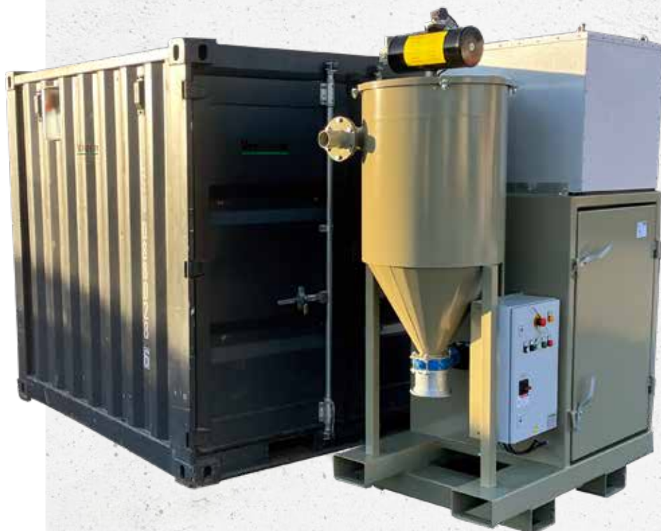
Blästerutrustning från Anti-Corrosions leverantörer Ventherm och Munkebo.

Blästring är en effektiv metod för att ta bort gammal bottenfärg.