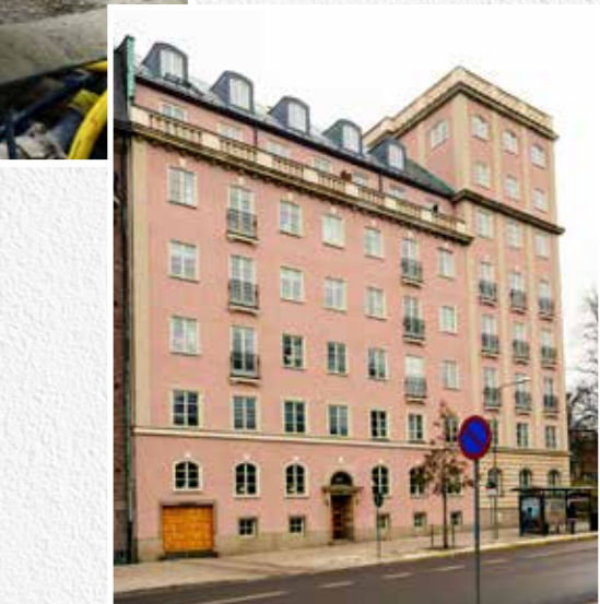
Fasaden på Strandvägen 65, ett av Kumla Fasadteams många prestigeprojekt.