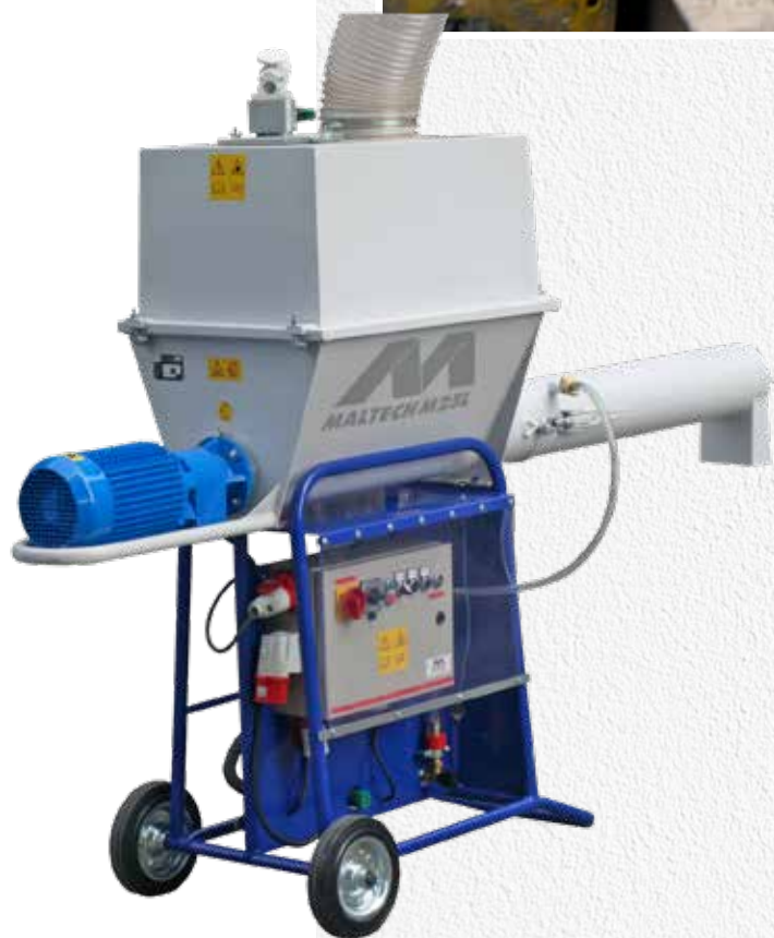
Automatblandaren Maltech M25 L.