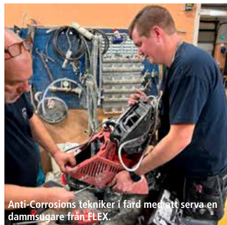
Anti-Corrosions tekniker i färd med att serva en dammsugare från FLEX.