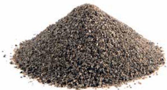
RR Blast Grit